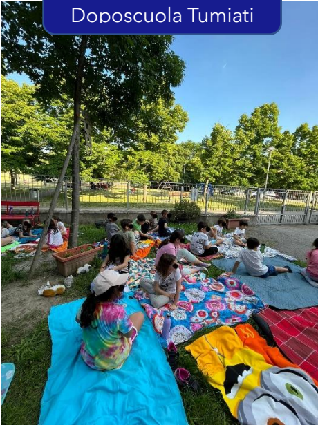
Festa fine anno Doposcuola Tumiatei