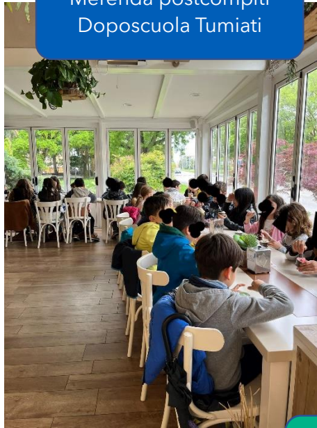
Merenda postcompiti Doposcuola Tumiatei