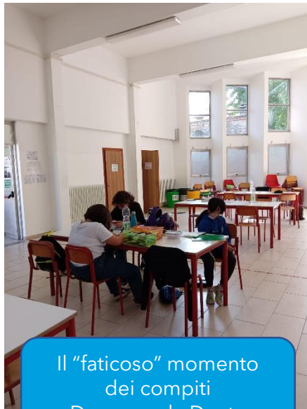
Il "faticoso" momento dei compiti Doposcuola Dante