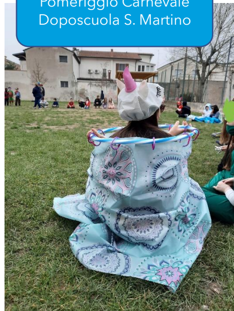
Pomeriggio Carnevale Doposcuola S. Martino