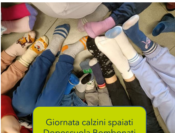
Giornata calzini spaiati Doposcuola Bombonati